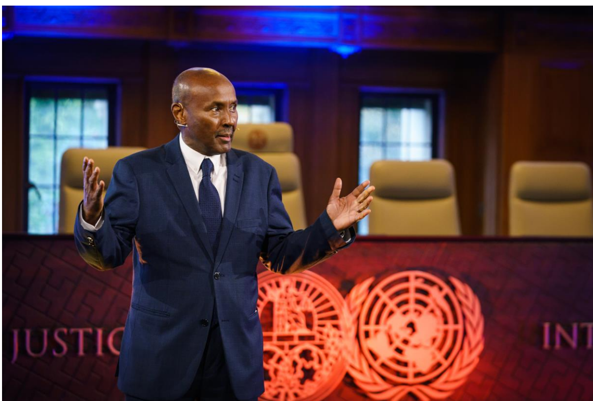
S. Exc. M. le juge Abdulqawi Ahmed Yusuf, président de la CIJ, lors de la manifestation «Faisons notre avenir ensemble», tenue au Palais de la Paix, siège de la Cour, le 24 octobre 2020, pour marquer le soixante-quinzième anniversaire des Nations Unies.